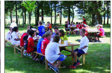
Un cadre et des conditions idéales: tous les repas de midi et du soir ont pu être pris en plein air. JLG