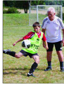
Des entraîneurs de qualité, dévoués et qui permettent à chaque jeune de progresser.

«Le Camp de Gimel, qui porte le label de l'ASF, c'est certainement le meilleur au rapport qualité-prix. Et il tient toutes les promesses», me fait remarquer un père de famille, visiblement heureux de voir son fils si rayonnant. ■