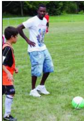
Le coup d'envoi du tournoi final a été donné par les joueurs du LS.