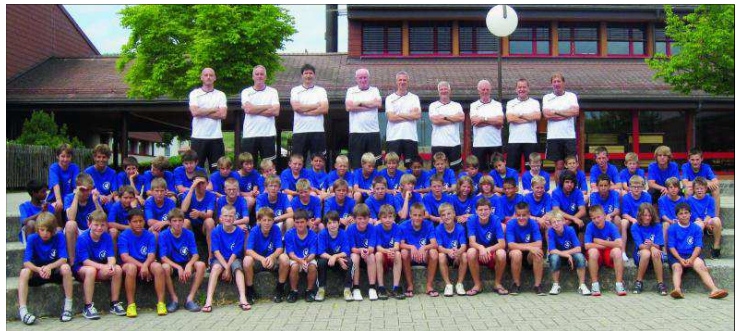
Les 61 jeunes présents lors de cette première semaine de camp, en compagnie de tout le staff d'encadrement.